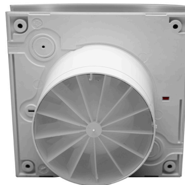
Compuerta anti retorno